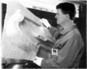
Pièce moulée pour véhicules

Le 3 e symposium technico-scientifique BIORESOURCE HEMP s'est déroulé du 13 au 16 septembre, au Congress Park de Wolfsburg. Plus de 300 participants et des orateurs venus de 28 pays ont profité de cette rencontre internationale de l'industrie du chanvre pour échanger des informations, élaborer des projets, initier des collaborations et prendre des contacts. Les quatre jours de conférences incluaient 80 présentations orales sur le chanvre (et autres plantes à fibres) : variétés, culture et récolte, séparation de la fibre, transformation et lignes de produits, marchés et économie, ainsi que le chanvre en médecine moderne. 12 exposants et 15 présentations de posters faisaient partie de l'exposition.