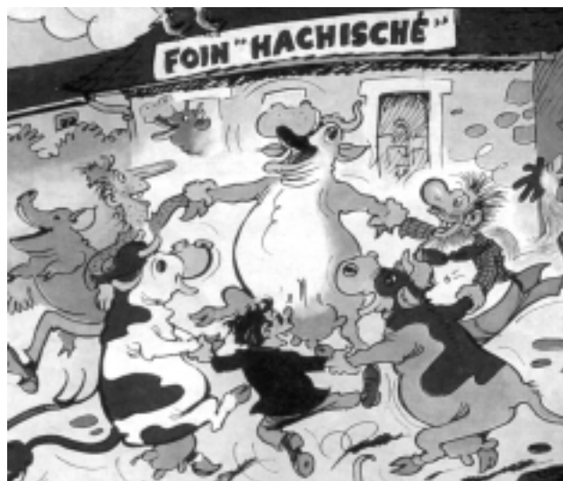
Les Pieds Nickelés de René Pellos

Le cannabis a toujours été largement utilisé en Asie pour traiter les maladies des animaux. Il est communément donné comme nourriture aux éléphants et aux boeufs pour soulager leur fatigue et leur donner plus d'endurance et de force. Les feuilles sont brûlées en tas pour désinfecter les étables et les écuries et pour traiter les problèmes respiratoires. Un mélange de fleurs de chanvre, de sucre et de grains est donné au bétail pour traiter les coliques, la constipation, la diarrhée, les vers et autres parasites, de même qu'une certaine forme de diphtérie qui affecte les bêtes. On le donne également avant l'accouplement et pour augmenter la production de lait (le cannabis est riche en protéines). Quand la volaille est régulièrement nourrie avec des graines de chanvre, elle ne dédaigne pas la nourriture et il n'est pas nécessaire de lui donner des hormones pour l'engraisser. La production d'oeufs s'en trouve également accrue. La graine de chanvre a un effet analogue à celui du grain dont on nourrit les poulets : elle conserve les parois du gésier en bonne condition.